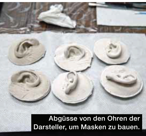
Abgüsse von den Ohren der Darsteller, um Masken zu bauen.