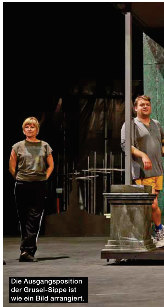
Die Ausgangsposition der Grusel-Sippe ist wie ein Bild arrangiert.