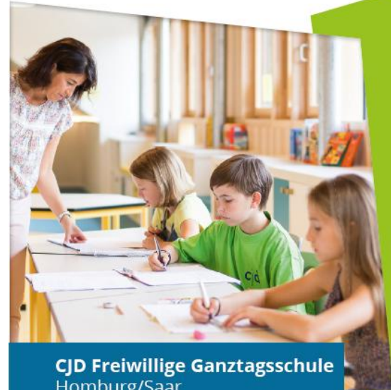
CJD Freiwillige Ganztagschule Homburg/Saar